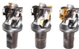
Reparaturservice für alle Wendeplatten-Werkzeuge