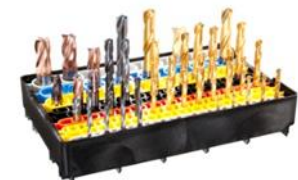
Nachbeschichtungsservice für Zerspanungswerkzeuge