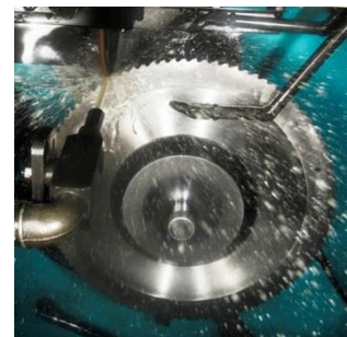
HSS-Segmentsägeblätter Nachschärfen und Reparatur