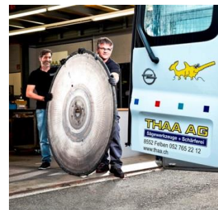
Thaa Werkzeugkurier, Abholservice in der deutschsprachigen Schweiz