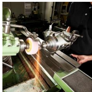
Werkzeuge für die Holzbearbeitung und diverse Handwerkzeuge