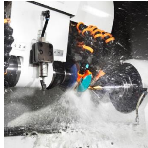
HSS/VHM Fräswerkzeuge für Metall- und Stahlbearbeitung