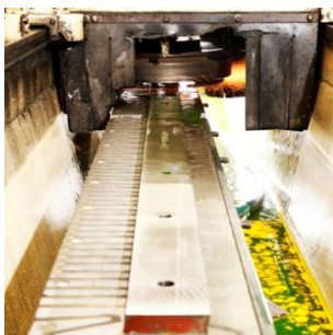
Messer für Metall-, Papier- und Lebensmittelindustrien

bohrer-recycling.ch Ein Projekt von Thaa AG und ABA Amriswil