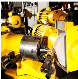
Bohrer, Senker und übrige Metallbearbeitungswerkzeuge