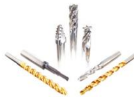
VHM/HSS Sonderwerkzeuge nach Kundenzeichnung, ab Losgrösse 1