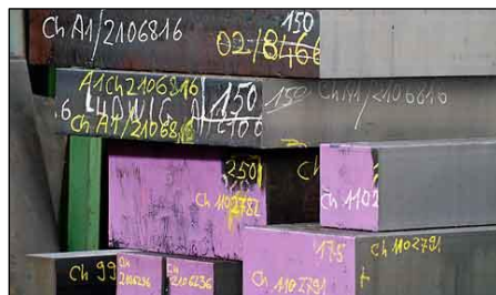
Stahl auf 7000 m 2 Lagerfläche

„Heute ist eine kurze Lieferzeit ein absolutes Muss. Damit unsere Kunden erfolgreich produzieren können, benötigen sie neben der Qualität auch diese kurzen Lieferzeiten. Daher stehen uns auch im Verkauf und der Logistik modernste Technologien zur Verfügung“, so Joos.