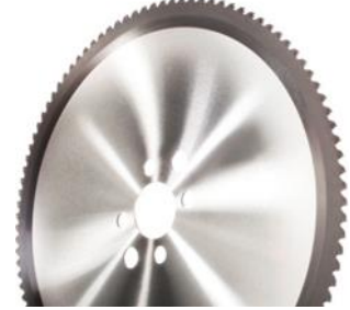
Hartmetall- und Cermetbestückte Kreissägeblätter für Stahl