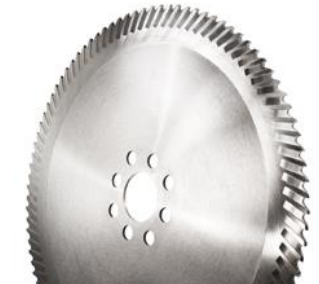
HSS-Segmentkreissägeblätter für Stahl- und NE-Metalle