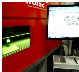
Laserbeschriftungen im Kundenauftrag