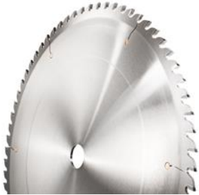
Hartmetallkreissägeblätter für Aluminium und NE-Metalle