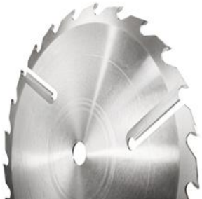
Hartmetallkreissägeblätter für die Holzbearbeitung