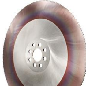
HSS-Metallkreissägeblätter DIN-Sägen nach 1837A + 1838B