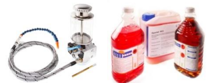
Minimalmengenschmiersysteme Kühlschmiermittel Emulsion/MMS