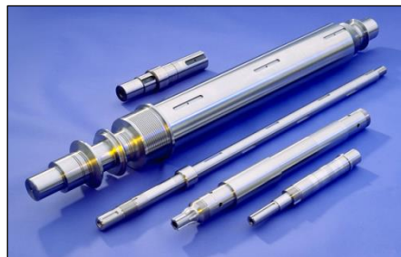
Wellen von K&V

Als Mitglied im Branchenverband SWISSMECHANIC setzen wir uns stark für die duale Bildung in der Schweiz ein und bilden dabei Polymechaniker, Produktionsmechaniker und auch kaufmännische Lernende aus.