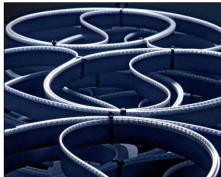
Bandsägeblätter in allen Abmessungen

Das umfangreiche Produktesortiment beginnt beim robusten Standardsägeband für Allrounder-Einsätze in der Werkstatt und geht hin bis zum individuell auf den Anwendungsbereich abgestimmten Bandsägeblatt, bei dem diverse Optionen wie Schneidkantenpräparation oder Hartstoffbeschichtung im Baukastensystem zusammengestellt werden (mit unserem Produkt WESPA IPC, Individual Performance Cutting®).