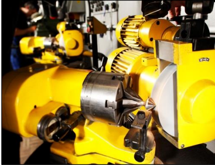
Nachschärfen von 90° HSS Senkern

Beim Nachschärfen von 90° Senkern bis 12,4 mm stossen wir ab und zu an unsere Grenzen: Durch die geringen Freiwinkel kann es auf Bearbeitungsmaschinen zu einer eingeschränkten Nutzbarkeit kommen. Beim normalen Einsatz ist es oft weniger problematisch.