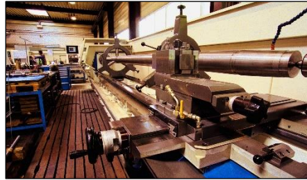
Einblick in die K&V Produktion

Ringe, runde Scheiben und Platten mit Toleranzen bis hin zu den physikalischen Grenzen.