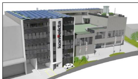
Konvekta Neubau Bezug per Ende 2021

Mitte der 70er Jahre begann Konvekta mit der Entwicklung von Software für die Regelung von Energie-Rückgewinnungs-Systemen. Seither wurde diese stets weiter modernisiert und erweitert. Mit Systemen von Konvekta kann der jährliche Energiebedarf für die Erwärmung der Aussenluft und die damit verbundenen CO2-Emissionen um 80 - 90% reduziert werden. Systeme von Konvekta werden täglich weltweit durch die Zentrale in der Schweiz elektronisch abgefragt und die Leistung der Systeme analysiert. Damit werden Fehler in Komponenten oder Störungen früh erkannt und können behoben werden damit keine Energieeinsparung verloren geht. Bei auftretenden Problemen stellt ein 24/7 Bereitschaftsdienst sicher, dass Kunden aus aller Welt jederzeit auf einen Ansprechpartner zurückgreifen können. Dank dieser umfassenden Dienstleistungen geniesst Konvekta einen sehr guten Ruf am Markt.