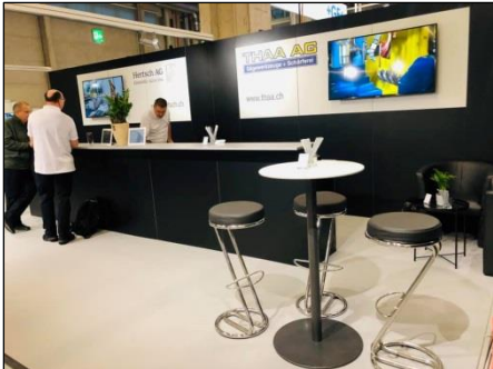
Hertsch und Thaa neu an der Innoteq

Gemeinsam mit dem Thaa Geschäftspartner Hertsch AG Edelstahl Zürich setzen wir ein Zeichen und nehmen im März 2021 an der neuen Leitmesse der Schweizer Industrie Innoteq in Bern teil.