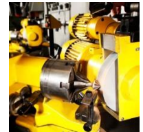
Bohrer, Senker und alle übrigen Metallbearbeitungswerkzeuge