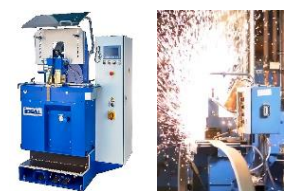
grosses Bandsägen-Schweisscenter Bi-Metall und HM-Bandsägeblätter