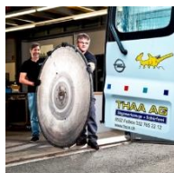
Thaa Werkzeugkurier in der deutschsprachigen Schweiz