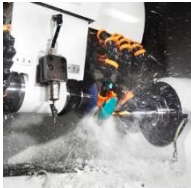
Bohr-/Fräswerkzeuge für die Metall- und Stahlbearbeitung (HSS/VHM)