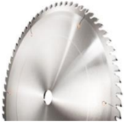
Hartmetall-Präzisionskreissägeblätter für Aluminium und NE-Metalle