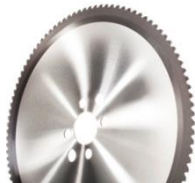
HM- und Cermet Sägeblätter für Stahl, Titan, Inox, ...