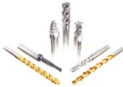
Herstellung von Stufen-, Sonder- und Formwerkzeugen, CNC-Schärfdienst