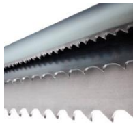
Kohlenstoff, Bi-Metall und hartmetallbestückte Bandsägeblätter