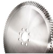
HSS-Segmentkreissägeblätter für Stahl- und NE-Metalle