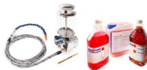
Minimalmengenschmiersysteme Kühlschmiermittel, Emulsion, MQL