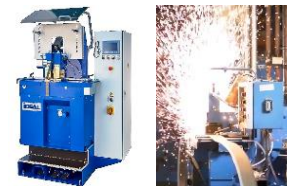
grosses Bandsägen-Schweisscenter, Bi-Metall und HM-Bandsägeblätter