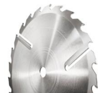
Hartmetallkreissägeblätter für die Holzbearbeitung