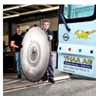
Thaa Werkzeugkurier in der deutschsprachigen Schweiz