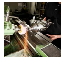
Werkzeuge für die Holzbearbeitung und diverse Handwerkzeuge