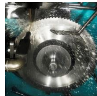
HSS-Segmentkreissägeblätter für Stahl- und NE-Metalle