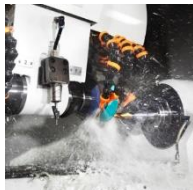
Bohr-/Fräswerkzeuge für die Metall- und Stahlbearbeitung (HSS/VHM)