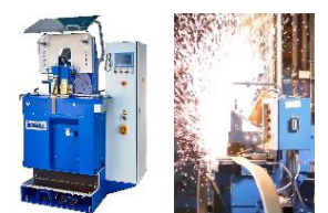
grosses Bandsägen-Schweisscenter Bi-Metall und HM-Bandsägeblätter