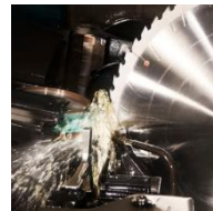
Hartmetallbestückte Kreissägeblätter NE-Metall/Stahl/Holz bis Ø 1600 mm