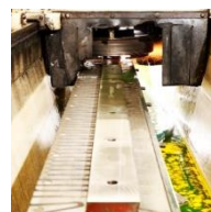
Kreis-/Langmesser für Metall, Blech, Papier, Verpackung, Lebensmittel...