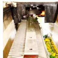
Kreis- und Langmesser für Metall, Blech, Papier, Verpackung, Food...