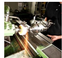
Werkzeuge für die Holzbearbeitung, Handwerker, Privat, Do it and Garten