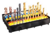
Hartstoffbeschichtungen und Ober- flächenfinish für alle Werkzeuge