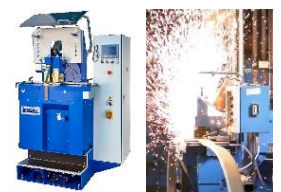
grosses Bandsägen-Schweisscenter f. Bi-Metall, CS- und HM-Sägebänder