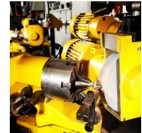
Bohrer, Senker und alle übrigen Metallbearbeitungswerkzeuge