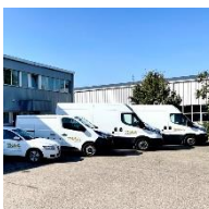
Werkzeugkurier von Thaa, verfügbar in der deutschsprachigen Schweiz