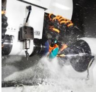
Schaftwerkzeuge in HSS/VHM für Bohren/Fräsen/Drehen/...