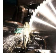
Hartmetall-Kreissägeblätter für NE-Metall/Stahl/Holz bis Ø 1600 mm